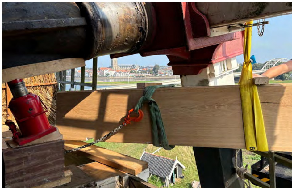
Vorzichtig wordt de balk naar binnengetrokken en op zijn plaats gemanoeuvreerd