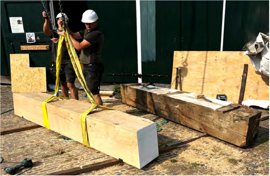
Oud en nieuw