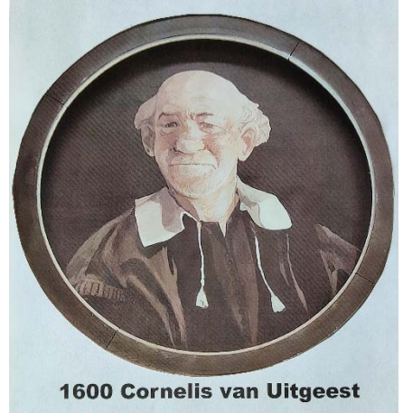
1600 Cornelis van Uitgeest

Op de bovenverdieping kun je genieten van wisselende exposities en films. De molenmakerij, gereedschappen en modellen zijn er te bewonderen. Ook de werking van de krukas is te zien. Onlangs stond in dagblad Trouw een artikel over de bedenker van de krukas. Cornelis Corneliszoon leefde in de 17 e eeuw. Zijn schoonvader vroeg hem een molen te bouwen. Hij maakte die molen zo dat die hout kon zagen. Tot dan werd dat met de hand gedaan.